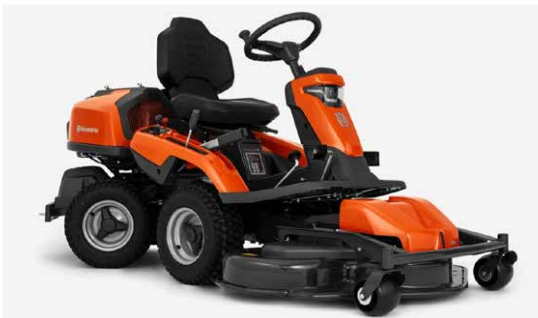
Rider 316 TsX AWD

De grasmaaier loopt op zijn laatste benen: de maaibak (het deel waarin zich de messen bevinden) is dusdanig versleten (er vallen gaten in door roest) dat hij vervangen moet worden. Deze maaibak is echter niet meer leverbaar. Dankzij het schoonmaakwerk van de grasmaaiers hebben we de machine al aardig langer in gebruik dan de afschrijvingsperiode. Maar het einde is nu dus in zicht. We kunnen hem tijdelijk nog wel gebruiken, maar aanschaf van een nieuwe is niet te vermijden. Uiteraard is gekeken naar de mogelijkheid van een elektrische maaier, maar die zijn niet leverbaar met het vermogen dat wij nodig hebben. Onze vaste leverancier B.T.N. de Haas, het bedrijf dat al jaren het jaarlijks onderhoud van de machines is doet, komt met twee suggesties van het merk Husqvarna.