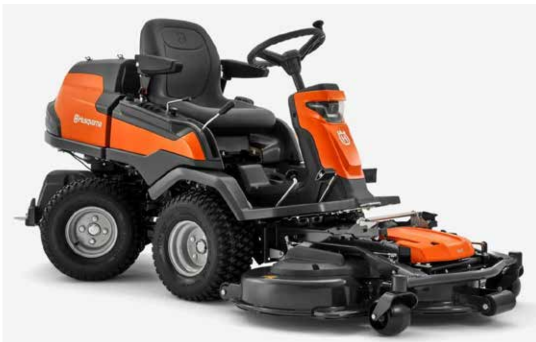
Rider R420TsX AWD